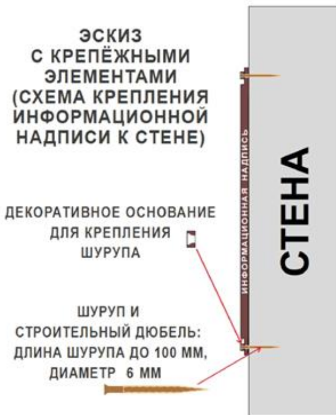
Схема крепления информационной надписи (пластины) к стене

Метод крепления информационной надписи предусматривает минимальное воздействие на объект культурного наследия и состоит из четырёх распорных дюбель-гвоздей с потайным бортиком SM-L 6/600, вкручивающихся сквозь отверстия в надписи в кирпичную стену. Толщина торцевой стороны надписи по высоте герба, текста и крепежных элементов не более 16 мм.