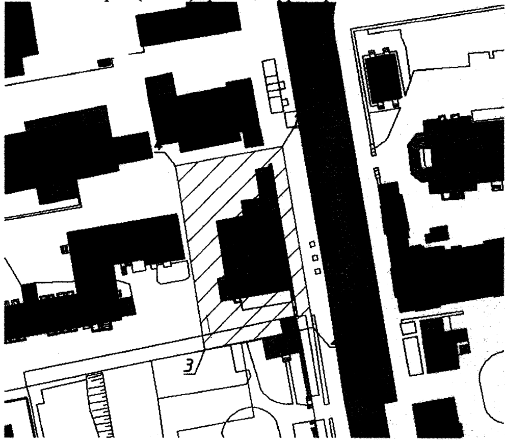
Условные обозначения к карте (схеме) границ территории Объекта