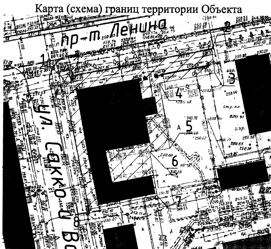
Условные обозначения к карте (схеме) границ территории Объекта