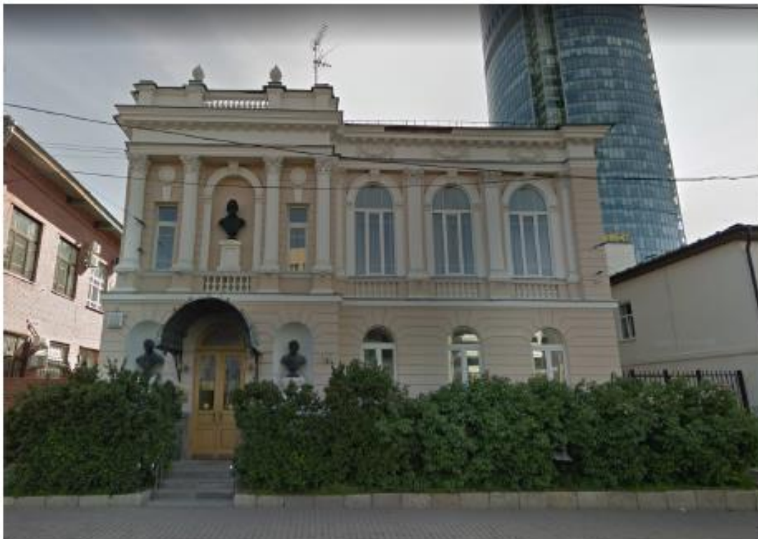
Фотофиксация объекта культурного наследия «Первая городская публичная библиотека им. В.Г. Белинского», Западный фасад, 2020 год

Фотографическое изображение Объекта в едином государственном реестре объектов культурного наследия (памятников истории и культуры) народов Российской Федерации: