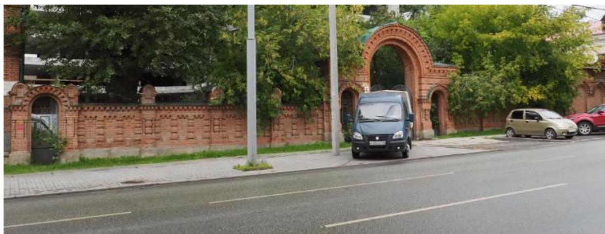
Фотофиксация Объекта сотрудниками ООО «Маковей»