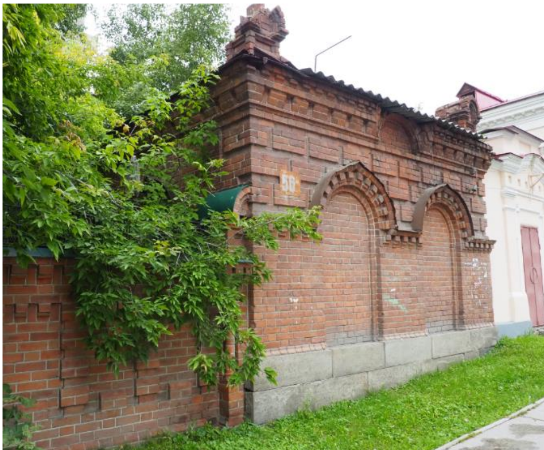
Фотофиксация Объекта сотрудниками ООО «Маковей» в сентябре

к акту государственной историко-культурной экспертизы документации, обосновывающей проведение работ по сохранению объекта культурного наследия регионального значения «Бывшая усадьба Железнова.» «Флигель.», расположенного по адресу: г. Екатеринбург, ул. Розы Люксембург, 56.