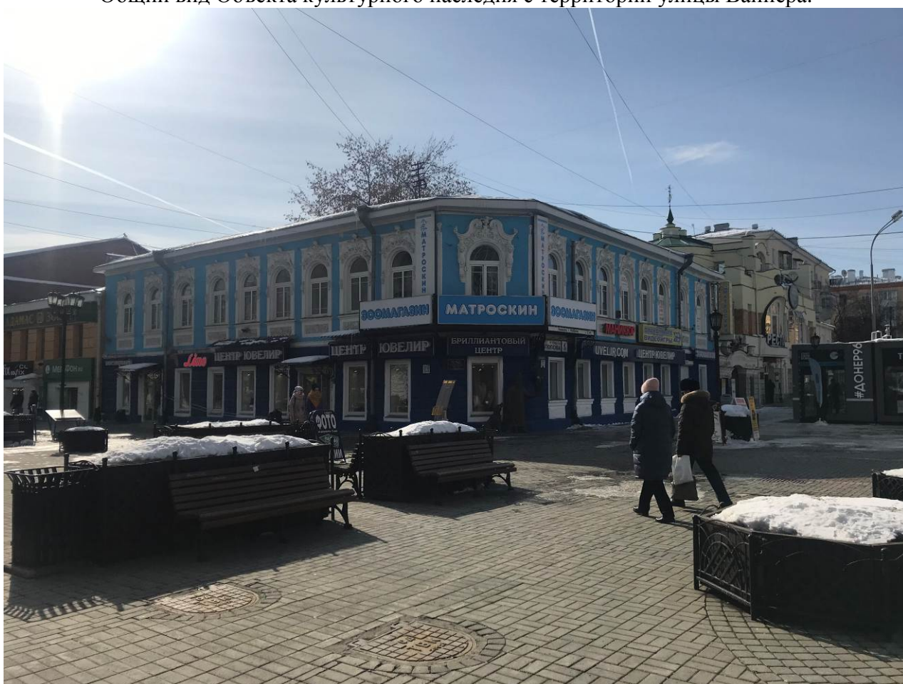
Общий вид Объекта культурного наследия с пересечения улиц Попова и Вайнера. Современное фото.