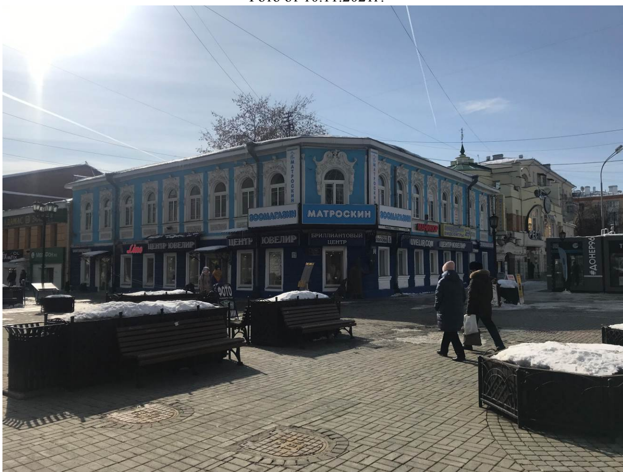
Общий вид Объекта культурного наследия с пересечения улиц Попова и Вайнера. Фото от 10.11.2021г.