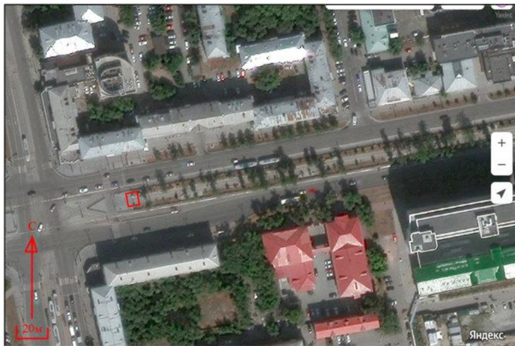
Рис. 2. г. Екатеринбург, пересечение пр. Ленина и ул. Московской. Космоснимок района проведения работ с нанесенной границей исследуемого участка.