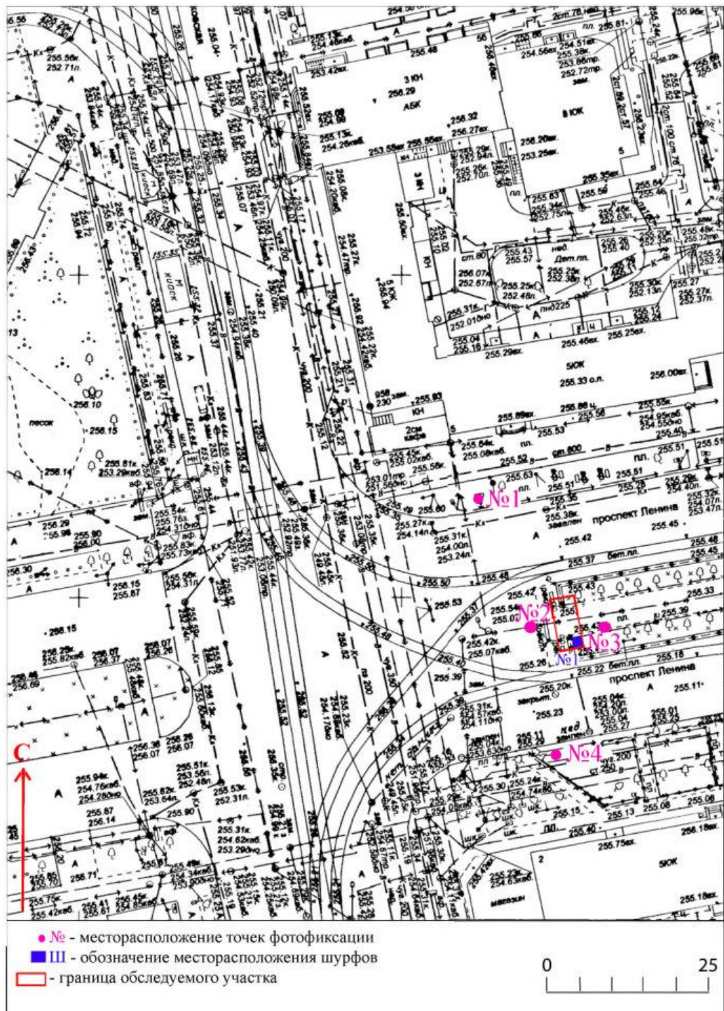
Рис. 3. г. Екатеринбург, пересечение пр. Ленина и ул. Московской. План обследуемого участка с обозначением точек фотофиксации.