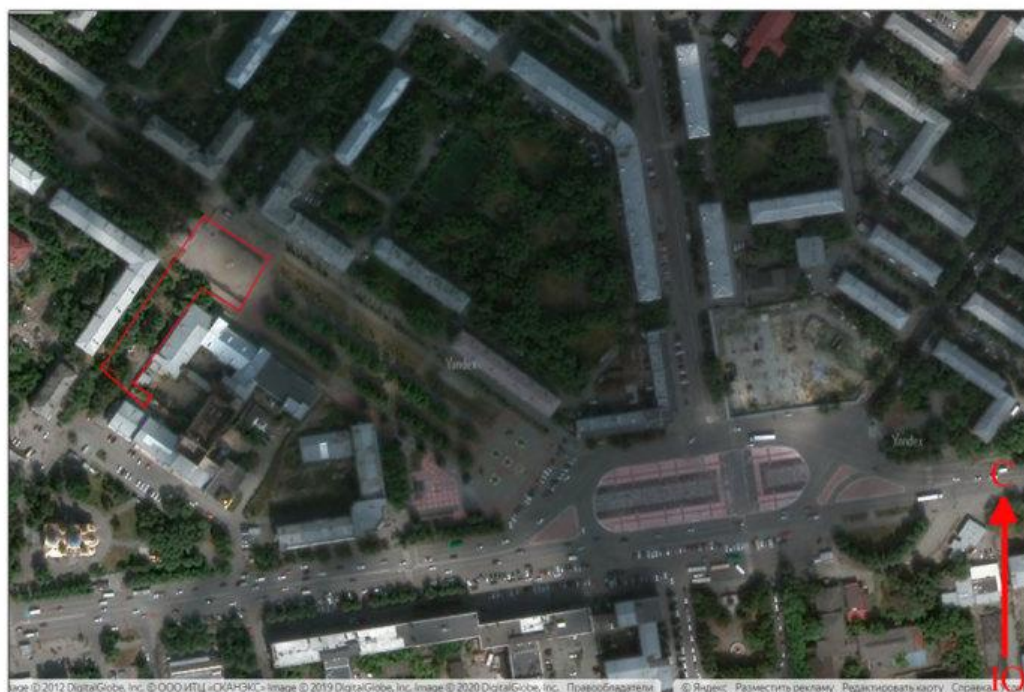
Рис. 2. г. Екатеринбург, пересечение бульвара Культуры и ул. Красных Партизан. Космоснимок района проведения работ с нанесенными границами испрашиваемого участка.