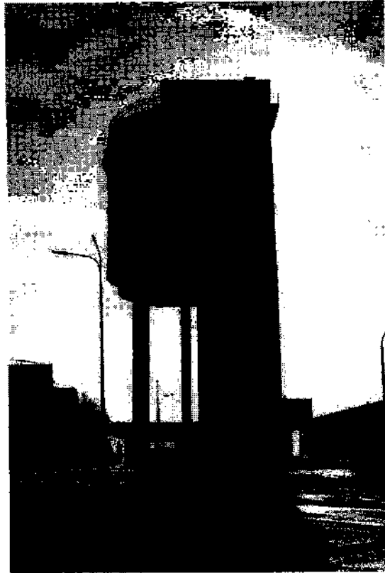
Фотографическое изображение объекта культурного наследия (вид с востока, март 2017)