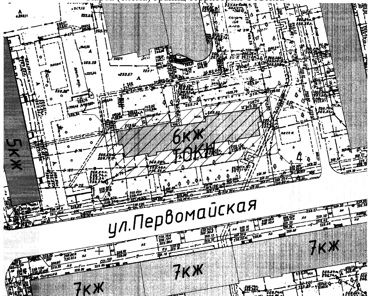
Условные обозначения к карте (схеме) границ территории Объекта