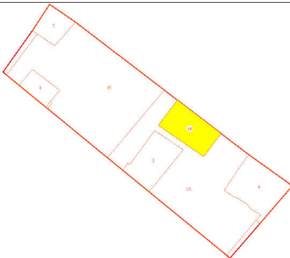
Схема кадастрового квартала.